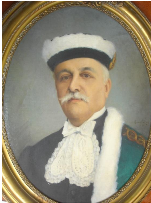
Fig. 1: Professor Catedrático de Clínica Pediátrica e Higiene Infantil