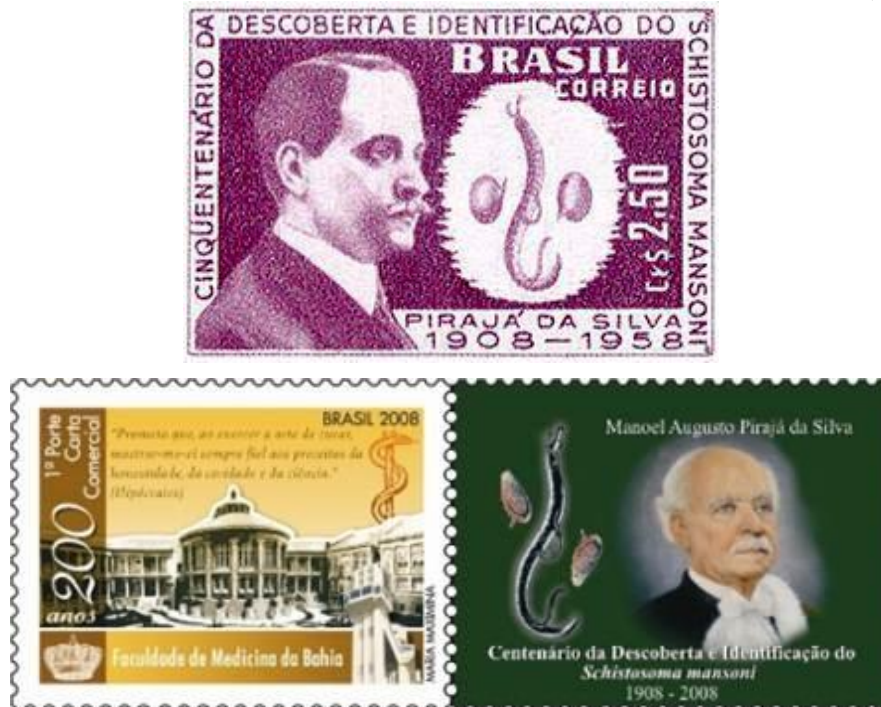
Figura 2 – COMEMORAÇÃO. 2.1. Selo comemorativo do cinquentenário da descoberta do S. mansoni (1908-1958); e 2.2. Selo do centenário da descoberta (1908-2008) e 2.3. Selo comemorativo do Bicentenário da FAMEB (18.02.2008);

Fonte: Bibliotheca Gonçalo Moniz, FAMEB,UFBA.